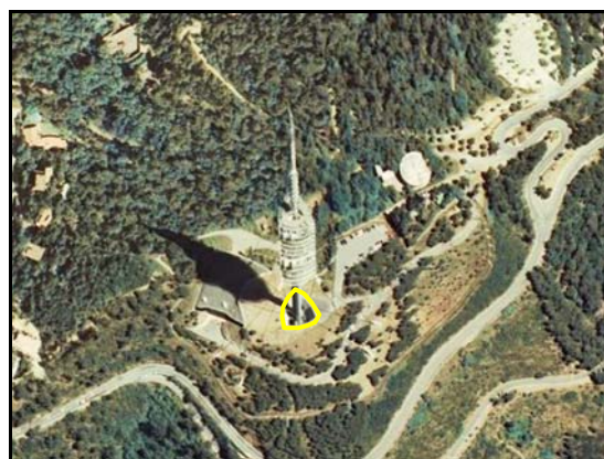
Ejemplos de Antena .